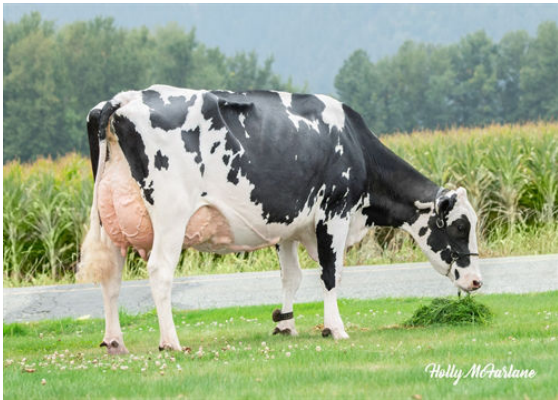
WESTCOAST ALCOVE RIZA 7512 DAM